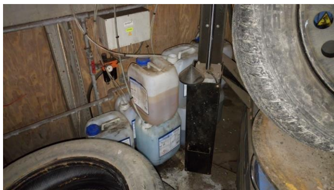
Billede 3: Opbevaring af vaskemidler til vaskehal (på tilsynet)