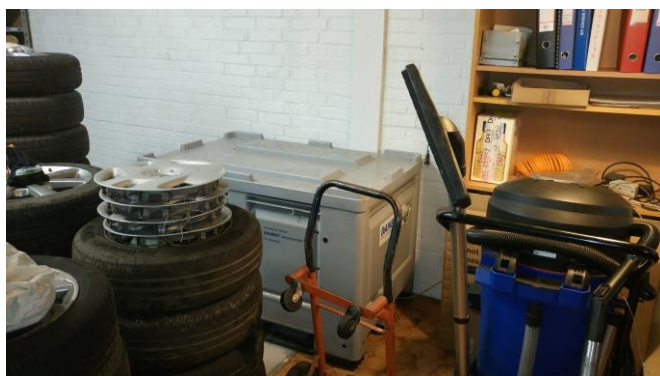
Billede 10: Kasse med brugte akkumulatorer