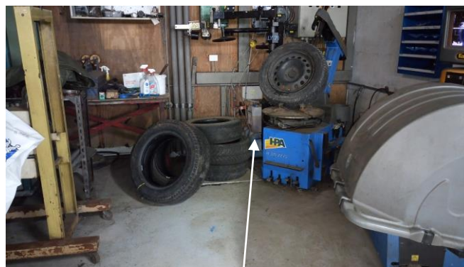
Billede 4: Opbevaring af vaskemidler til vaskehal