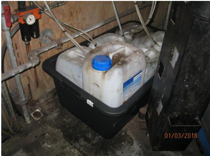
Billede 5: Opbevaring af vaskemidler (efter tilsyn)