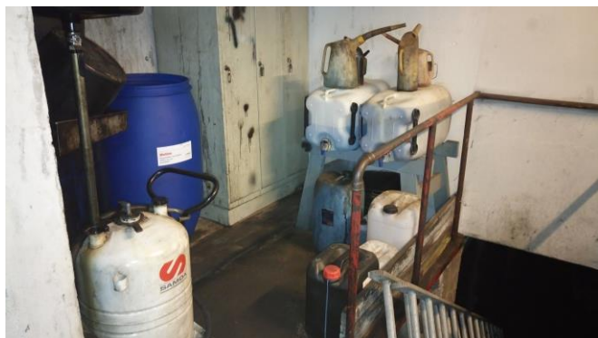
Billede 7: Opbevaring af køle- og sprinklervæske