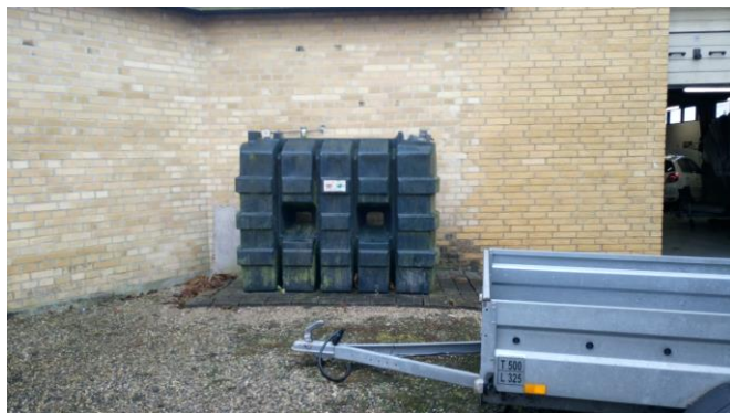
Billede 9: Udendørs fyringsolietank