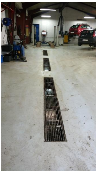
Billede 6: Afløb i værksted