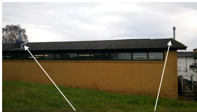
Billede 2: Afkast fra udstødning. Afkast fra svejserøg.