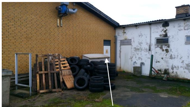
Billede 1: Oplag af dæk. Kompressor