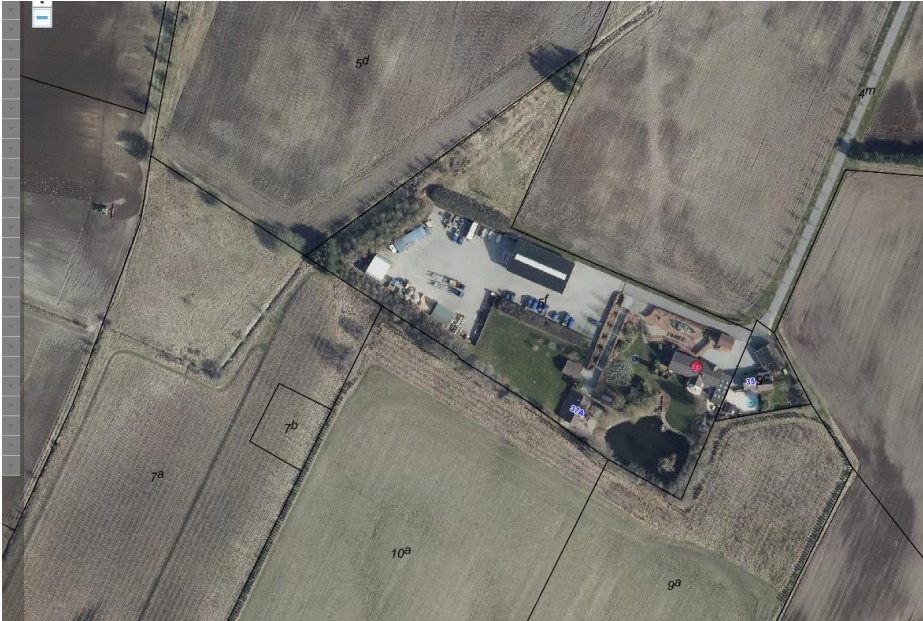
Luftfoto af virksomheden i 2023, Grønvej 37, matr. nr. 5f