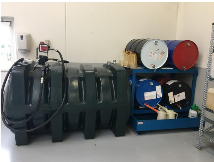
Dieseltank og opbevaring af råvarer.

Virksomheden er en anlægsvirksomhed, der primært udfører belægningsopgaver med maskiner samt snerydning. Virksomheden udfører ikke anlægsgartneropgaver og således ikke opgaver med håndtering af pesticider eller gødningsstoffer. Virksomheden er indrettet med maskinhal, kontor og et mindre værksted samt en udendørs vaskeplads til køretøjer. Virksomheden råder over følgende kørende materiel: 9 gummigeder, 6 læggemaskiner og 2 gravemaskiner. Der er 28 ansatte på virksomheden. Der foregår ikke olieskift og service af køretøjerne på adressen, kun efterfyldning af motorolie og påfyldning dieselolie. Tanken står indendørs på epoxybelagt gulv. Det blev ikke konstateret spild i forbindelse med tilsynet. Råolie stod på spildbakker.