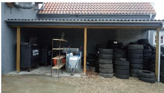
Billede nr. 1: Oplagsplads for bl.a. farligt affald

Virksomheden har etableret en overdækket plads med bund af fliser og uden opkant. På pladsen er der placeret beholdere fra ABAS, spildolietanken samt containere til pap og papirmv. Der var ingen synlige spild på fliserne.