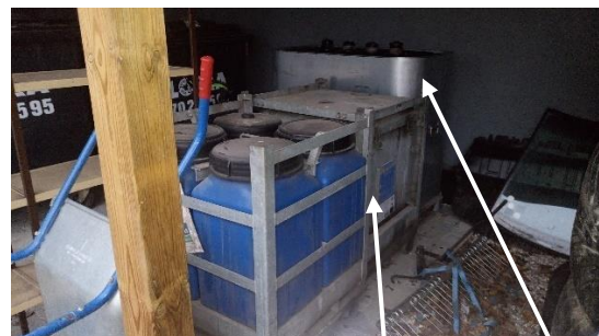
Billede nr. 2: Beholdere fra ABAS samt spildolietanken.