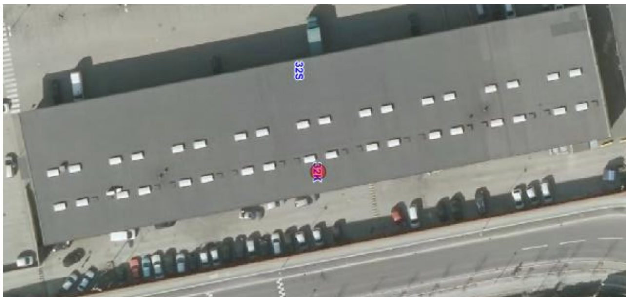
Luftfoto af bygningen Edwin Rahrs Vej 32 K, anno 2018

I forhold til kommuneplanen ligger virksomheden i område 240509CE, der er fastlagt til centerformål. Lokalplan 793 gælder for området. Virksomheden "Daizer auto gør det selv" ligger i underetagen af en bygning, der er en del af Bazar Vest – se nedenstående luftfoto. Underetagen er indrettet med flere mindre værksteder, der ligger på en række – se næste side.