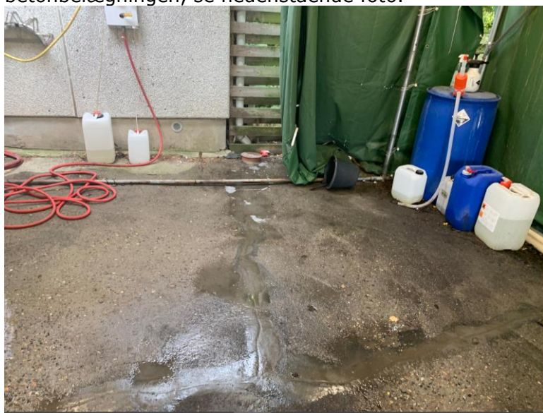
Foto af vaskeplads. Der står vand på den øverste del af vaskepladsen. Vandet løber ikke til afløbsristen men ud på jorden.

Ved tilsynet kunne det konstateres, at spildevandet fra en del af vaskepladsen løb ud på jorden i stedet for til afløbsristen. Dette skyldes sandsynligvis sætninger under betonbelægningen, se nedenstående foto.