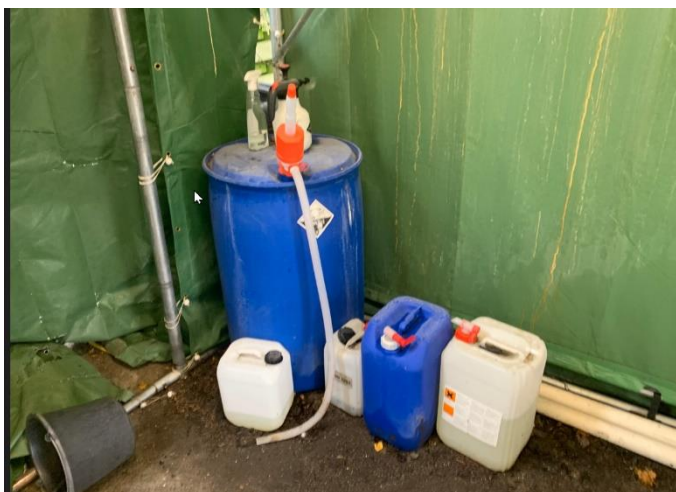
Foto af tromle til blanding af rengøringsmidler. Det blev aftalt med Ole, at alle tromler og dunke fremover opbevares i klargøringsrummet, som ikke har afløb til kloak.

Virksomhedens råvarer opbevares indendørs i klargøringen på betongulv og i original emballage. Der er desuden en 200 liters tromle som bruges til blanding af sæber, som kan bruges på vaskepladsen til rengøring af bilerne.