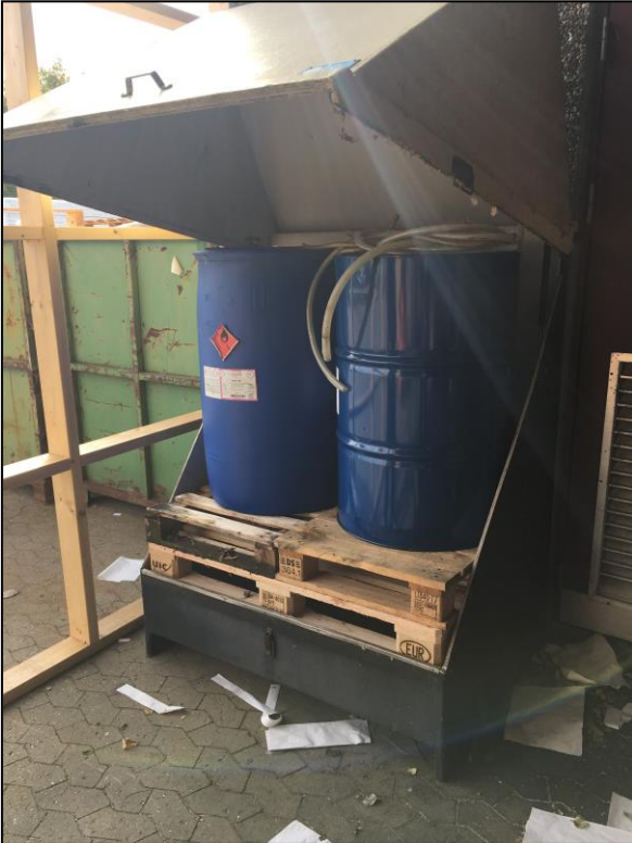
Foto af overdækket kemikalieopbevaring i miljøbakke.

Der blev spurgt til kravene for opbevaring af olier og kemikalier, så risikoen for forurening ved spild begrænses. Efter aftale indsættes her et link til Aarhus Kommunes forskrift for opbevaring af olie og kemikalier :