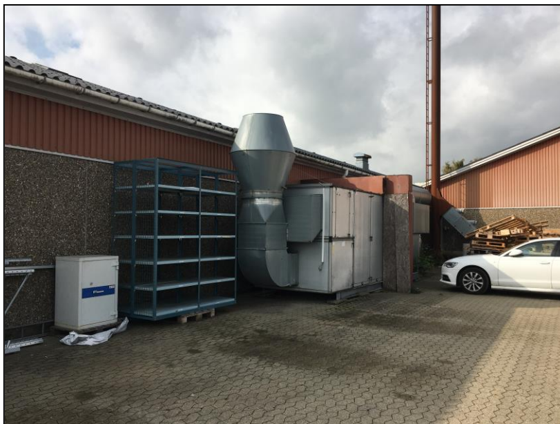
Foto af udsugningsanlæg til højre. Placering se på oversigtstegningen.