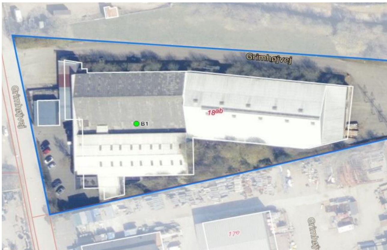
Luftfoto af virksomheden med matrikelskel fra BBR

I forhold til kommuneplanen ligger virksomheden i erhvervsområde 240505ER, der er udlagt til erhverv. Der er ingen boliger i nærheden af virksomheden.