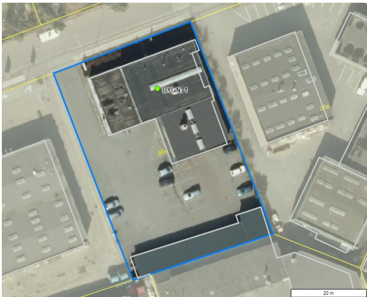
Luftfoto af virksomheden med matrikelskel

I forhold til kommuneplanen ligger virksomheden i område 160403ER, der er udlagt til erhvervsformål.