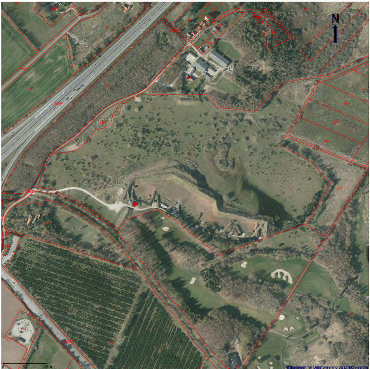
Figur 2: Østjysk Flugtskydning Center, Kærgårdsvej 14, 8700 Horsens. Skydebanen med tilhørende støjvolde ses midt i billedet. Motorvejen ses mod nordvest og Silkeborgvej ses mod sydvest. Matrikelskel er markeret med rødt.