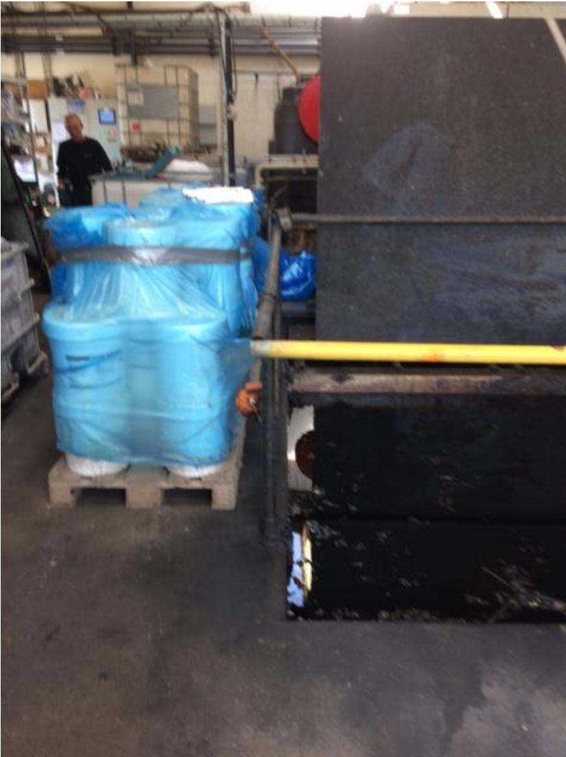
Disse var uden dørs ved sidste tilsyn, flyttet til hallen.