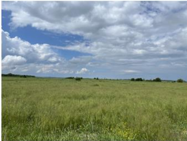
Foto af deponiet set fra mellemdepotet mod nordvest.