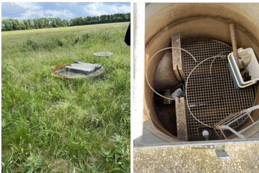
Fotos, der viser samlebrønd udefra og indefra til udtagning af drænvandsprøver.

En stikprøvekontrol i virksomhedens interne oversigter for 2021 viste, at der var tilført 22,86 t TS, hvilket er under 120 t TS pr. år jf. vilkår 10 i gældende miljøgodkendelse. Det blev aftalt, at virksomheden fremsender oversigt over årligt tilførte mængder i t TS, fra 2018 frem til nu. Frist for fremsendelse den 4. september 2024