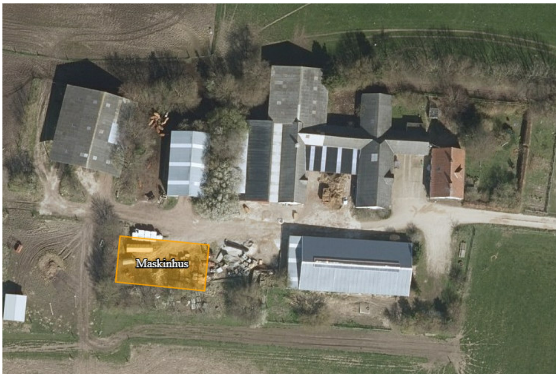
Figur 1: Placering af nyt maskinhus

Den anmeldte bygning med maskinhus overholder de i husdyrgodkendelsesbekendtgørelsens § 10 nævnte betingelser (bilag 2). Det anmeldte kan således bringes til udførelse i henhold til Husdyrbrugloven. Bemærk dog at denne afgørelse ikke fritager fra krav om eventuel tilladelse, godkendelse, dispensation eller lignende efter anden lovgivning og for andre bestemmelser, herunder at: Etablering af maskinhuset ikke må igangsættes, før der er givet byggetilladelse fra Gribskov Kommune.