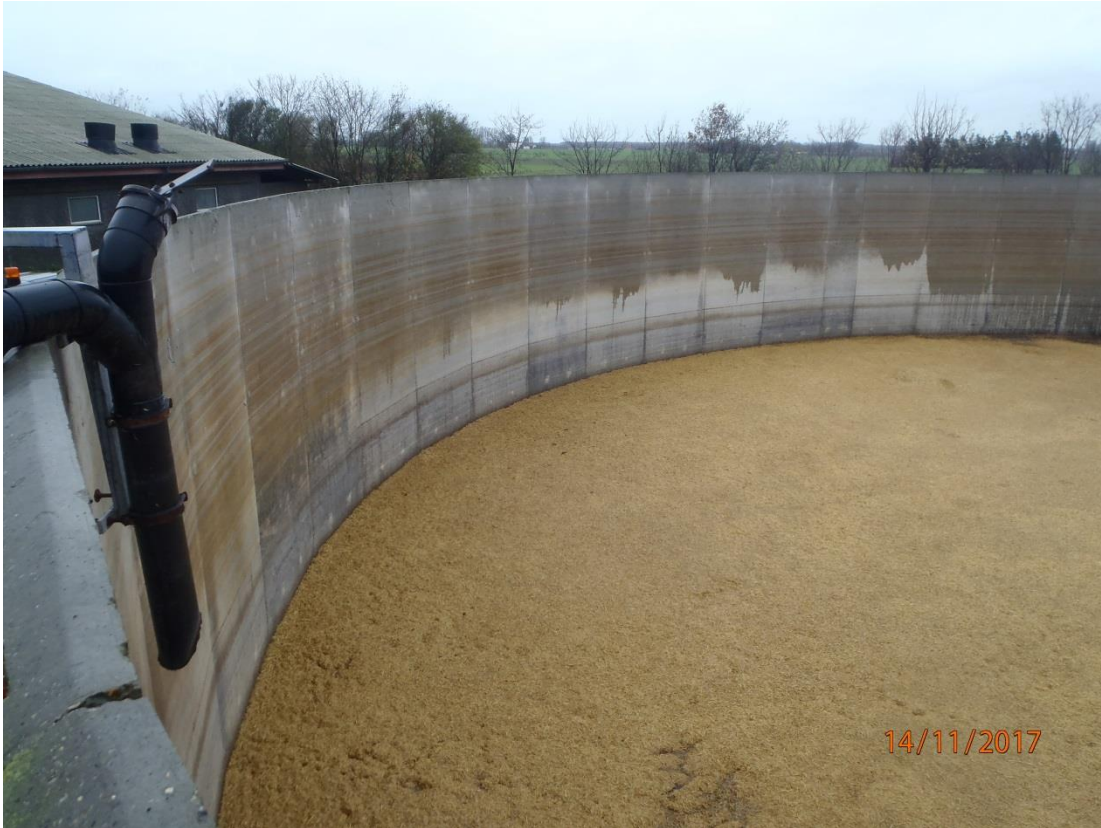
Billedet viser manglende rør-længde på indløbet i gyllebeholderen