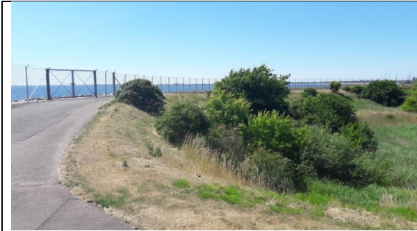
Lavningen længst mod syd hvor der ikke er deponeret. Aflåst hegn omkransende anlægget.