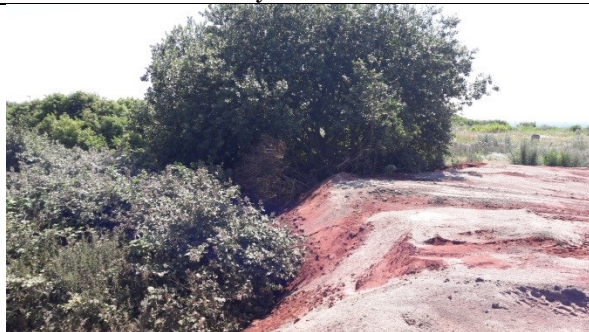
Lidt ældre tipfront delvist afdækket med sand.