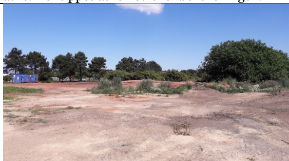
Centralt på deponiet med sandafdækket aske taget mod nordøst og tipfronten.