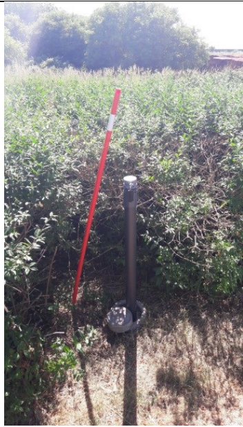
C6 – med vandtæt lukning og lås men uden beskyttelsesbrønd.