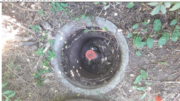
C4 med vandtæt lukning og lås i lav beskyttelsesbrønd.