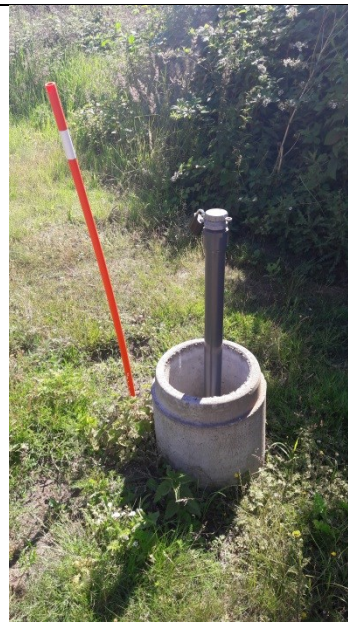
C5 - med vandtæt lukning og lås på det høje rør og lav beskyttelsesbrønd.

Indretningen af overvågningsboringerne opfylder ikke fuldt ud gældende krav i Brøndborerbekendtgørelsen 1 .