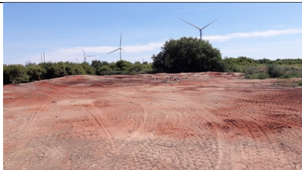
Fra indkørslen mod tipfronten (sydøst).