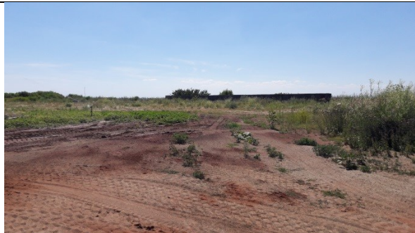
Fra indkørslen mod sydvest med støvmur.