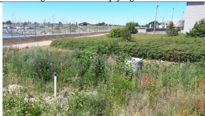
Ny PB3 til venstre og gammel PB3 til højre. Monitoringsboring. Den nye boring er med vandtæt lukning og lås på det høje rør men uden beskyttelsesbrønd.