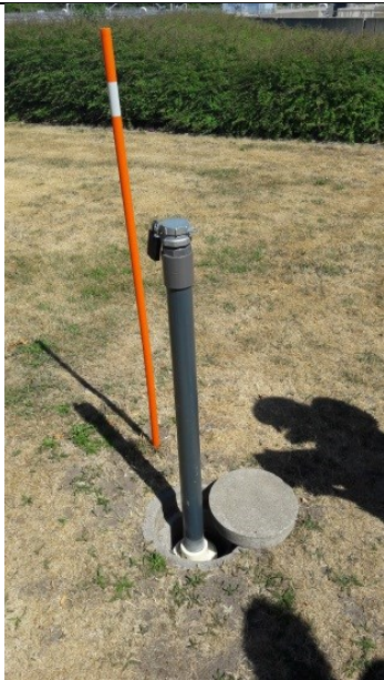
PB4 – monitoringsboring med vandtæt lukning og lås men uden beskyttelsesbrønd.