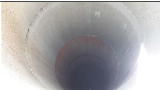
B2 inden i.