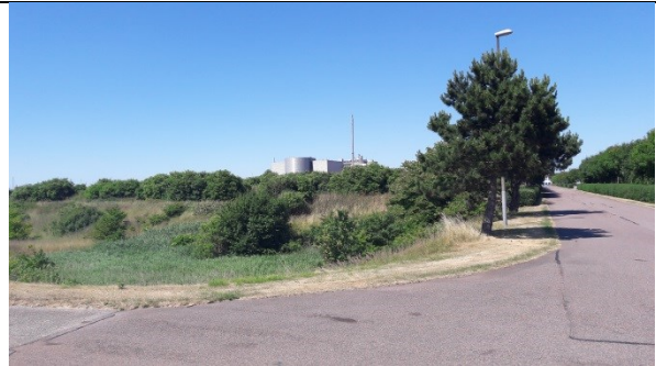
Lavningen længst mod syd og den nord-sydgående vej, der afgrænser deponiet.