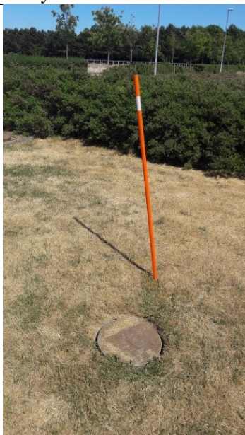
PB1 – monitoringsboring med vandtæt lukning og lås og lav beskyttelsesbrønd.