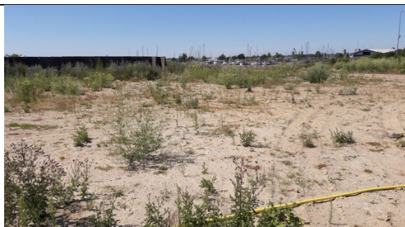
Centralt på deponiet med sandafdækket aske og støvmur mod nordvest og lysbådehavnen.