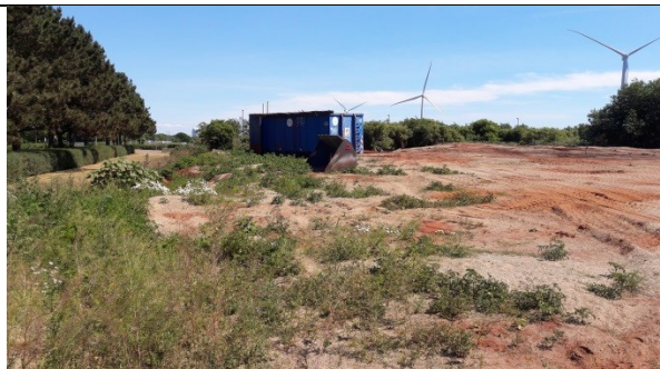
Fra indkørsel til deponiet mod tipfronten (øst) med tomme containere.