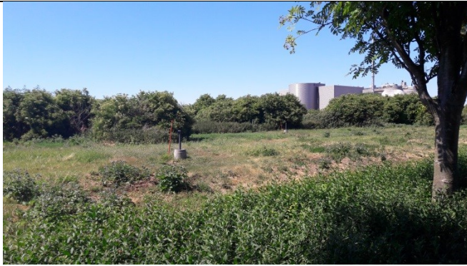
C3 og bagerst C2 – begge med lavere beskyttelsesbrønd og høj, afproppet, aflåst rør.