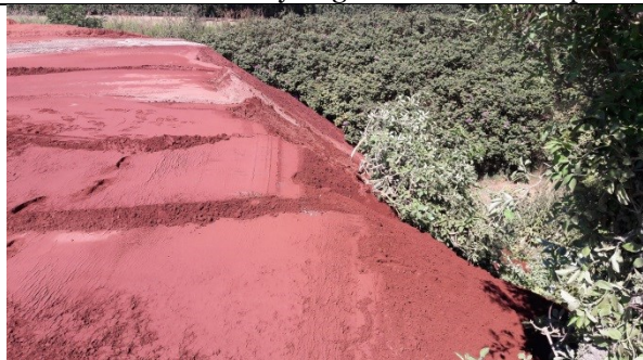
Tipfronten øst for indkørslen med befugtet, ny aske. Der tippes aske ned over bevoksningen.