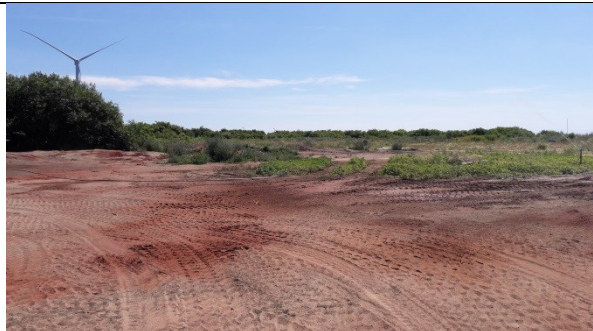
Fra indkørslen mod syd og sandafdækket deponi.