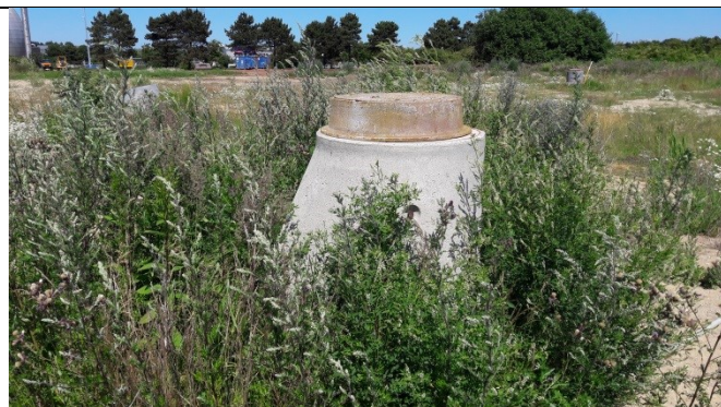
B2 med C1 i baggrunden til højre. Begge brønde hule uden rør og anvendes kun til pejling.

Fotos af overvågningsboringerne fra midt/nord og mod uret rundt på deponiet.