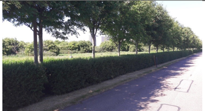
C3 og bagerst C2 – begge med lavere beskyttelsesbrønd og høj, afproppet, aflåst rør.