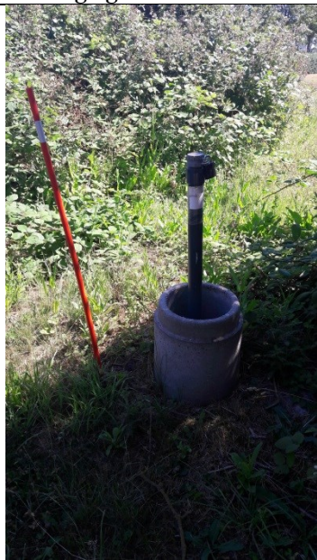
B1 - med vandtæt lukning og lås på det høje rør og lav beskyttelsesbrønd.