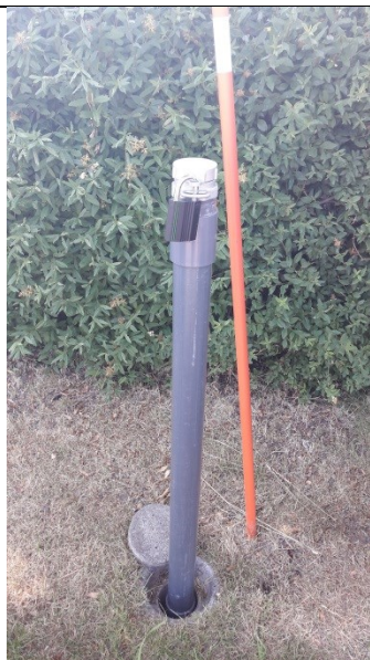
PB2 – monitoringsboring med vandtæt lukning og lås på det høje rør men uden beskyttelsesbrønd.