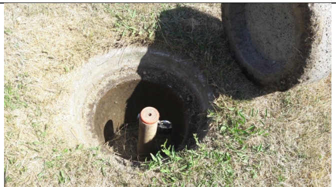
PB1 – monitoringsboring med vandtæt lukning og lås og lav beskyttelsesbrønd.