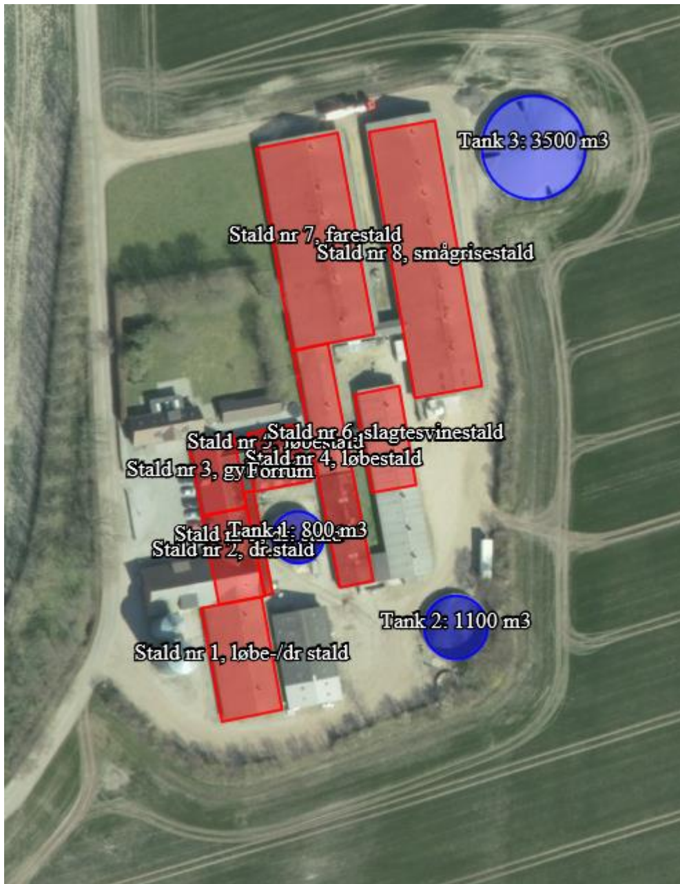
Bilag 1: Oversigt over husdyrbrugets anlæg, stalde, gyllebeholdere, siloer osv.