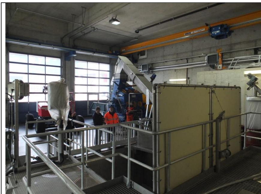
Anlæg til forbehandling