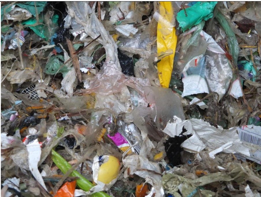
Restproduktet fra procesanlægget er et rejekt der afleveres til forbrænding eller genbrug