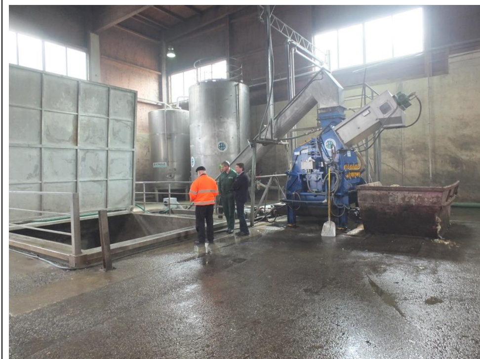
Anlæg til forbehandling med silo