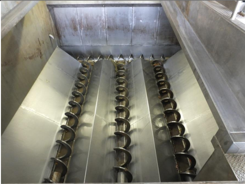
Anlægget modtager det organiske affald via en aflæsningssilo med akselløse snegle, der mikser og opskærer sække