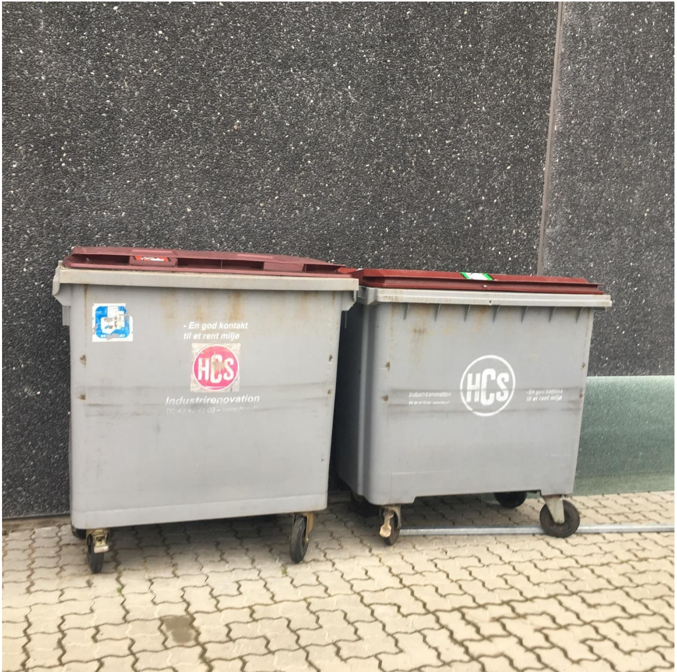
Blandet brændbart affald og pap som afhentes af HCS.