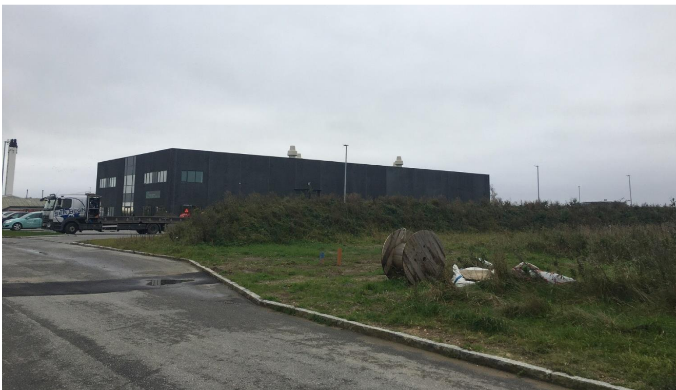
Luftemissioner – der er 4 afkast før mindst 1 meter over tag.