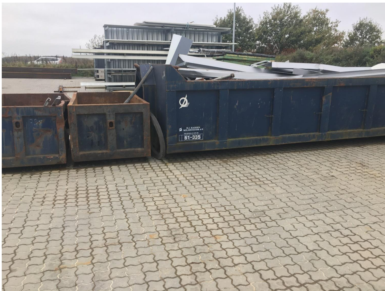
Sorteret jernskrot afhentes af HCS