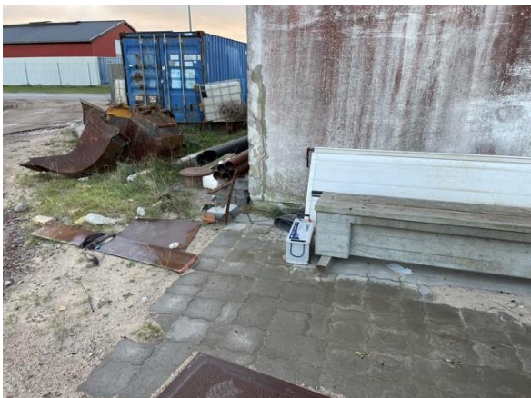
Bil batteri oplagret udendørs