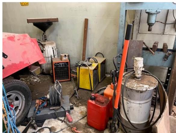
Flydende væsker er ikke oplagret i spildbakke