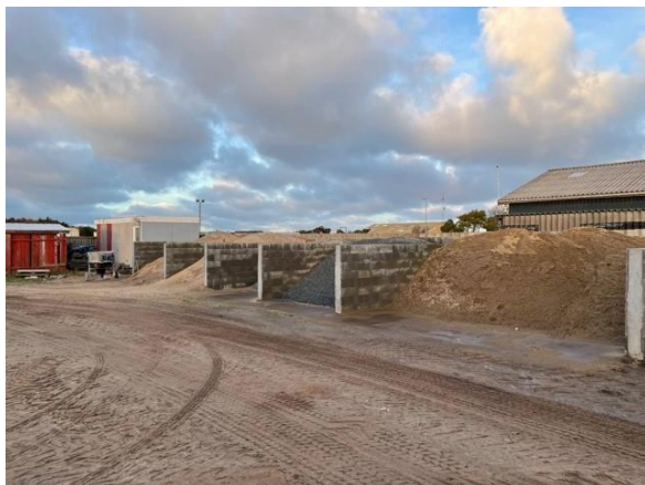
Båse med forskellige materialer