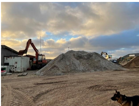
Oplag af ikke knust beton