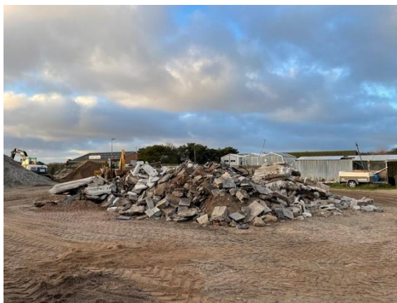
Oplag af ikke knust beton