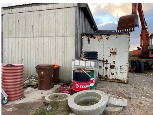
Tomme tromler, pallettank med et mindre indhold, muligvis olie