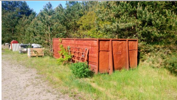
Billede nr. 5: Opbevaring af metalaffald.