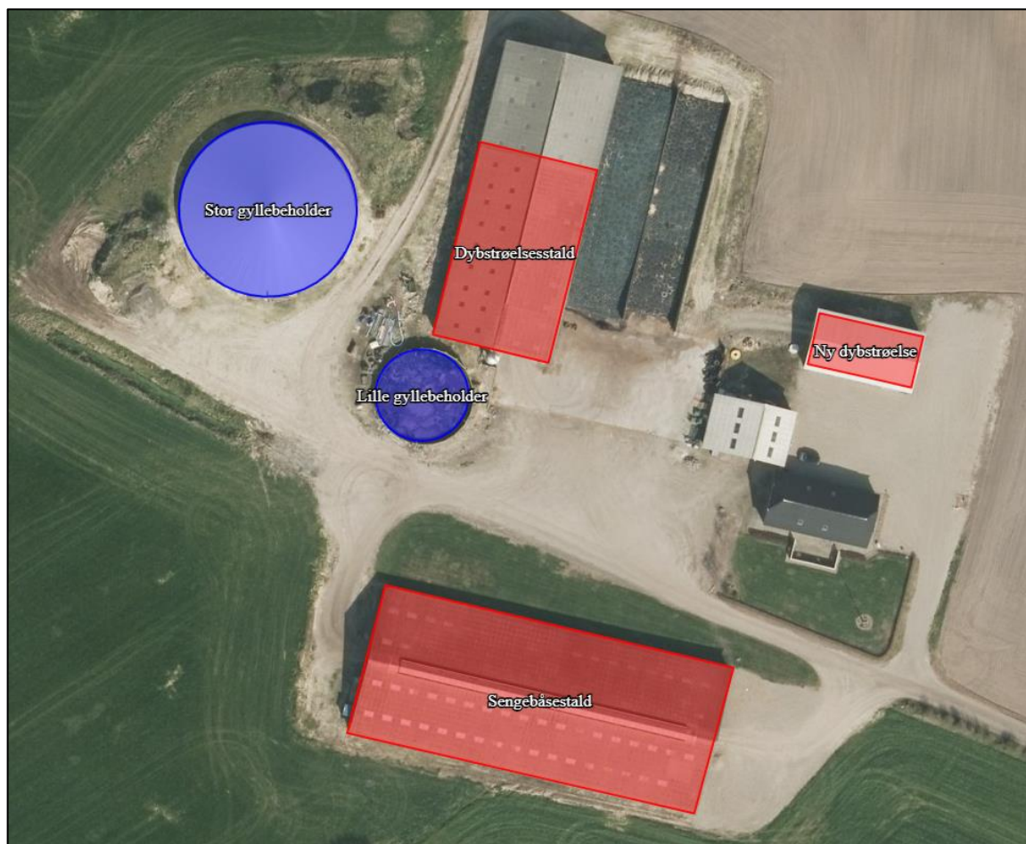
Figur 1. Oversigt over stalde, anmeldelsespligtige anlæg samt gødnings- og ensilageopbevaringsanlæg.

Det godkendte staldanlæg kan med denne tillægstilladelse udnyttes fuldt ud inden for grænserne for dyrevelfærdsreglerne. Se en oversigt over stalde i Figur 1.