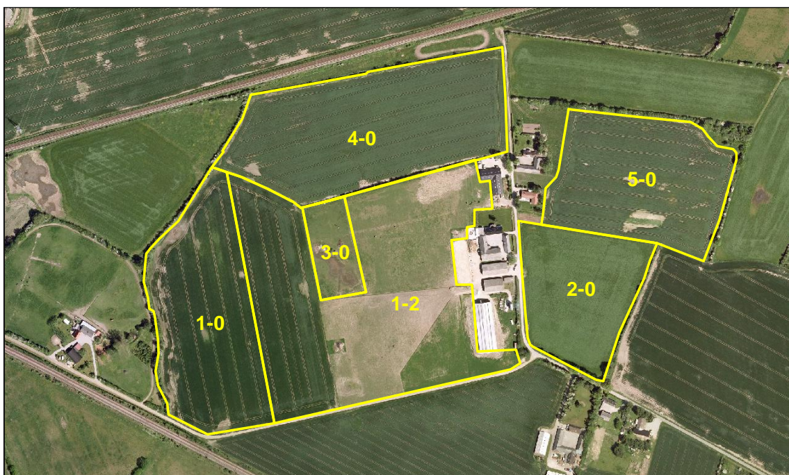
Luftfoto over ejendommen Tingskovvej 31

til udvidelse af hestehold på Tingskovvej 31, 7000 Fredericia