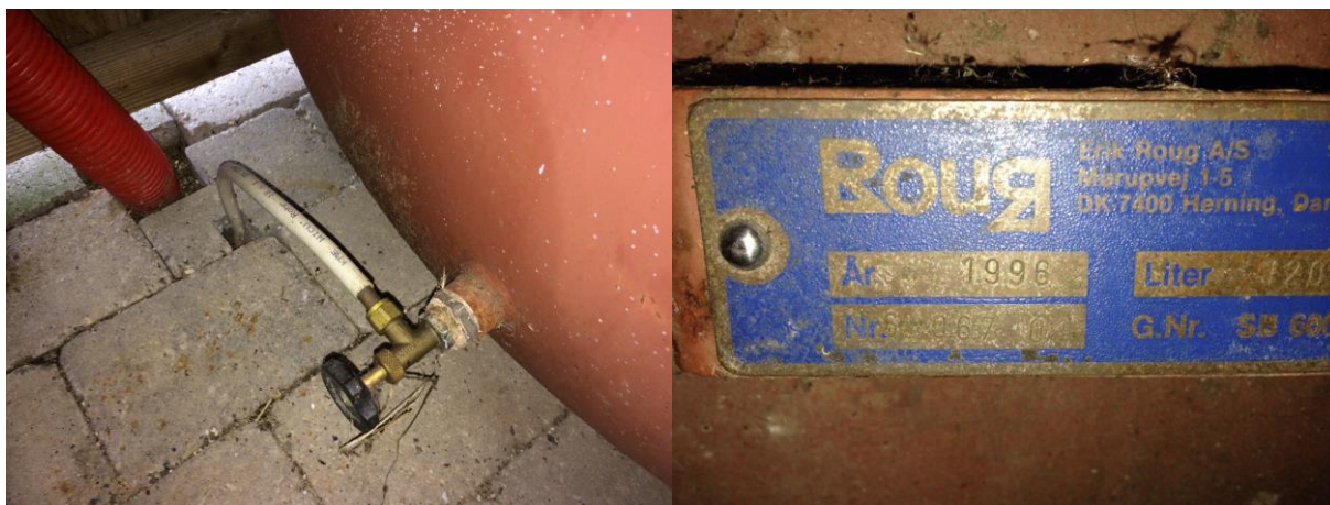
Mærkningplade på olietank og enkeltstrenget rørføring i plastbelagt rør.

Opvarmning sker med oliefyr. Der er etableret en 1200 liters Roug olietank (nr. 64067 01) fra 1996.