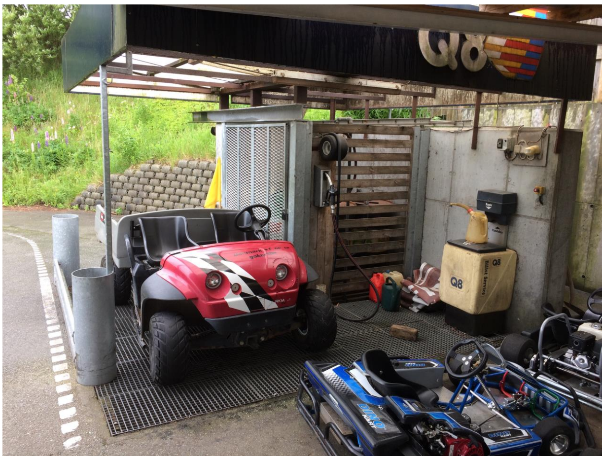
Opbevaring af benzin og øvrige væsker på overdækket 4x4 meter stort betonkar.

Der opbevares benzin til karts i benzintromler, der er placeret over et overdækket 4x4 meter stort tæt betonkar. Opbevaringsanlægget er sikret med autoværn.