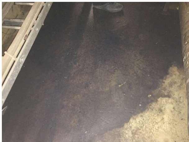
Spild på betongulv i ingeniørgang