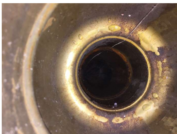
Afløb, hvor spildevandet fra olieseparatoren udledes.