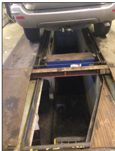
Lift over grav i værkstedslokalet. Graven var tør og uden afløb

Værkstedetsareal inkl. kontorafsnit: 174 m 2