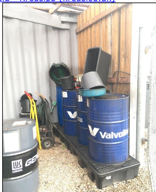
Foto af opbevaring af spildolietromler på miljøriste

Det vurderes, at virksomheden opbevarer farligt affald i overensstemmelse med kravene i Autobranchebekendtgørelsens § 13 stk. 1 med opsamlingsbassin/bakke.