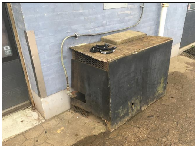
Kompressor placeret udendørs i trækasse

Afstanden fra værkstedet til nærmeste bolig er ca. 60 meter, mens afstanden til nabo-virksomheden er ca. 30 meter.