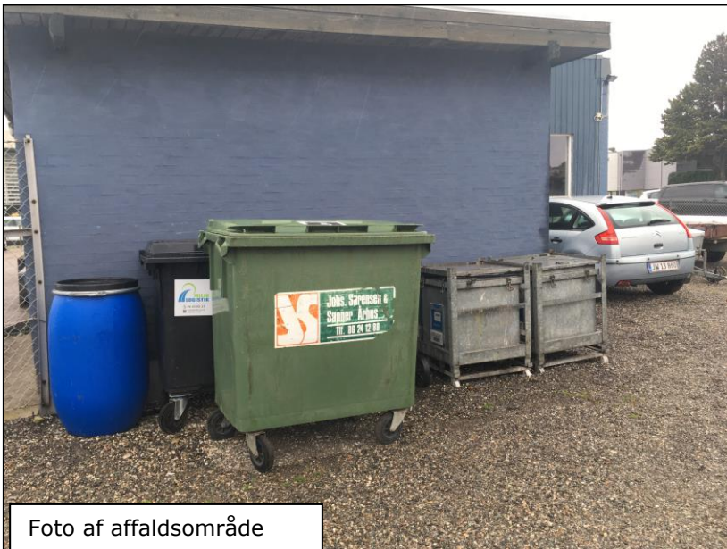
Foto af affalds område