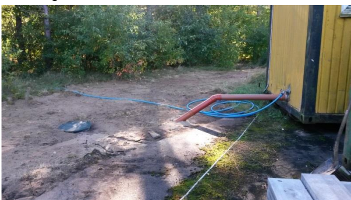
Billede 1 – nedgravet samletank

På banearealet er der udover et klubhus opsat 2 containere til opbevaring af diverse udstyr til træning og interne løb. Der er også opsat en toilet/omklædningsvogn hvortil der i slutningen af september er nedgravet en septiktank (se billede 1). Tanken tømmes af NKI Kloak- og Industriservice Ebeltoft.