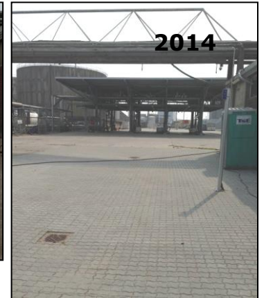
Foto af brønddæksler ved tidligere vaskeplads, som nu er inddraget til udkørselsområde for læsseramperne.

Områdets forandring ses af foto, som bevares i rapporten som dokumentation for virksomhedens historik.