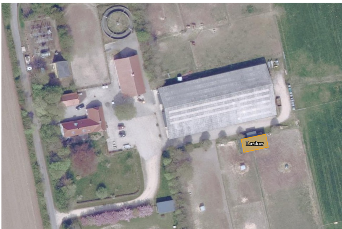
Figur 1. Læskurets placering.

Den udarbejdede scenarieberegning med skema nr. 244 714, version 2, viser, at lugt- og ammoniakemissionen ikke øges med det ansøgte, hvorved kravet om, at lugt- og ammoniakemissionen ikke må forøges med det anmeldte, jf. husdyrgodkendelsesbekendtgørelsens 2 § 20, stk. 5, er overholdt.