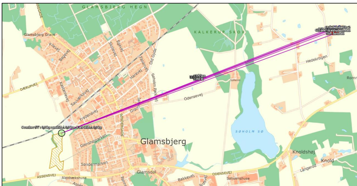
Figur 2: Placering af kategori 2-naturområde i forhold til Hedekrogen 14 (og 12) – fra husdyrgodkendelse.dk.

Ifølge Danmarks Miljøportal kortværk over registrerede naturarealer ligger nærmest kategori 2-naturområde ca. 3,3 km sydvest for staldanlægget og er et overdrev – se figur 2.