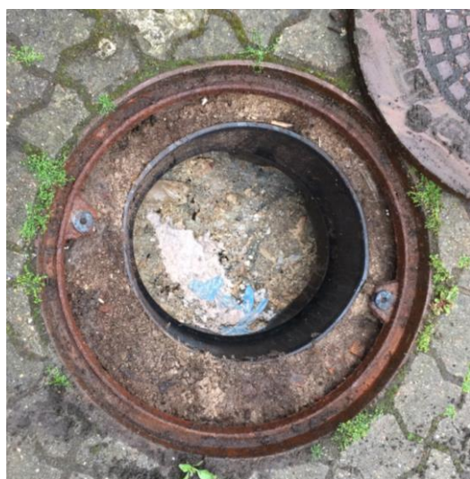
Billeder af fedtudskiller. I laget af fedt var der en gennemsigtig plasticpose og et par blå gummihandsker

Fra fedtudskilleren blev spildevandet inden tilledning til hovedkloakken ledt videre til en brønd. Der blev ikke konstateret hverken lugt fra eller slagteriaffald i denne.