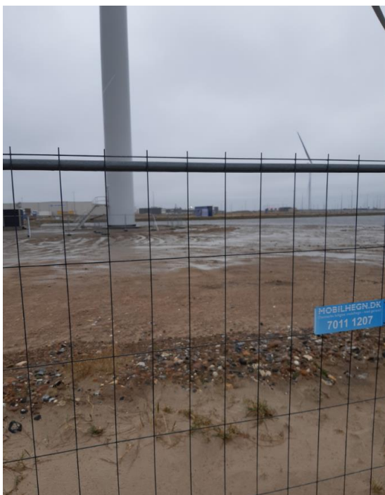
Foto 4. Der er etableret en vindmølle på deponiet areal. Der er angiveligt brugt rent sand som fundament.

Efterfølgende er det klarlagt, at der ikke forefindes analyser af materialet. Der er blot kendskab til at materialet kommer fra indsejlingen af Hirtshals Havn.