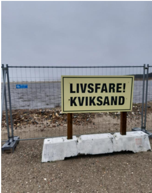
Foto 1. omkransende hegn og tydelig fareskiltning

Der var sat omkransende hegn på deponiet, se foto 1. Der var desuden sat tydelige fareskilte op.