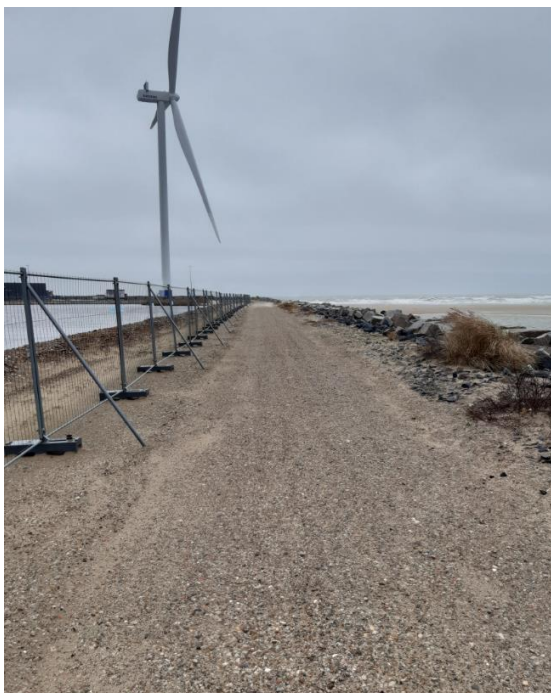
Foto 3. Tilstand af diget

Af foto 4 fremgår der at der er blevet etableret en vindmølle på deponiets nord-østlige del. Vindmøllen står angiveligt på rent sand og jord, opgravet fra havbunden. Det blev aftalt at journal, med mængde og analyser for materialerne, fremsendes i forbindelse med kommende årsrapportering.