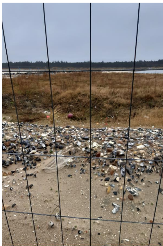
Foto 6. Plastic o.l. blæst ind på deponiet.

Der håndteres ikke affald på deponiet. Der var få rester flamingo o.l som tilsyneladende var blæst ind over heget. Se foto 6. Forholdet udgør ikke en miljømæssig farer.