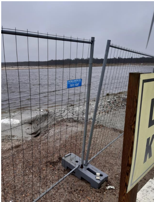
Foto 2. Indgangen til deponiet.