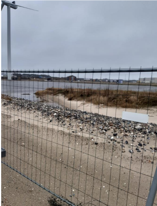
Foto 5. Deponeret sediment fra 2017.

For det deponerede sediment, har der ikke været indsendt oplysninger som anført af vilkår B9. Vilkåret vil blive indskærpet. Miljøstyrelsen har af mail d. 27.feb. 2020 tilsendt Hirtshals Havn en opfordring til opfyldelse af vilkår B9, ifm. indsendelse af årsrapport. Der er d. 28. april modtaget dokumentation af dette.