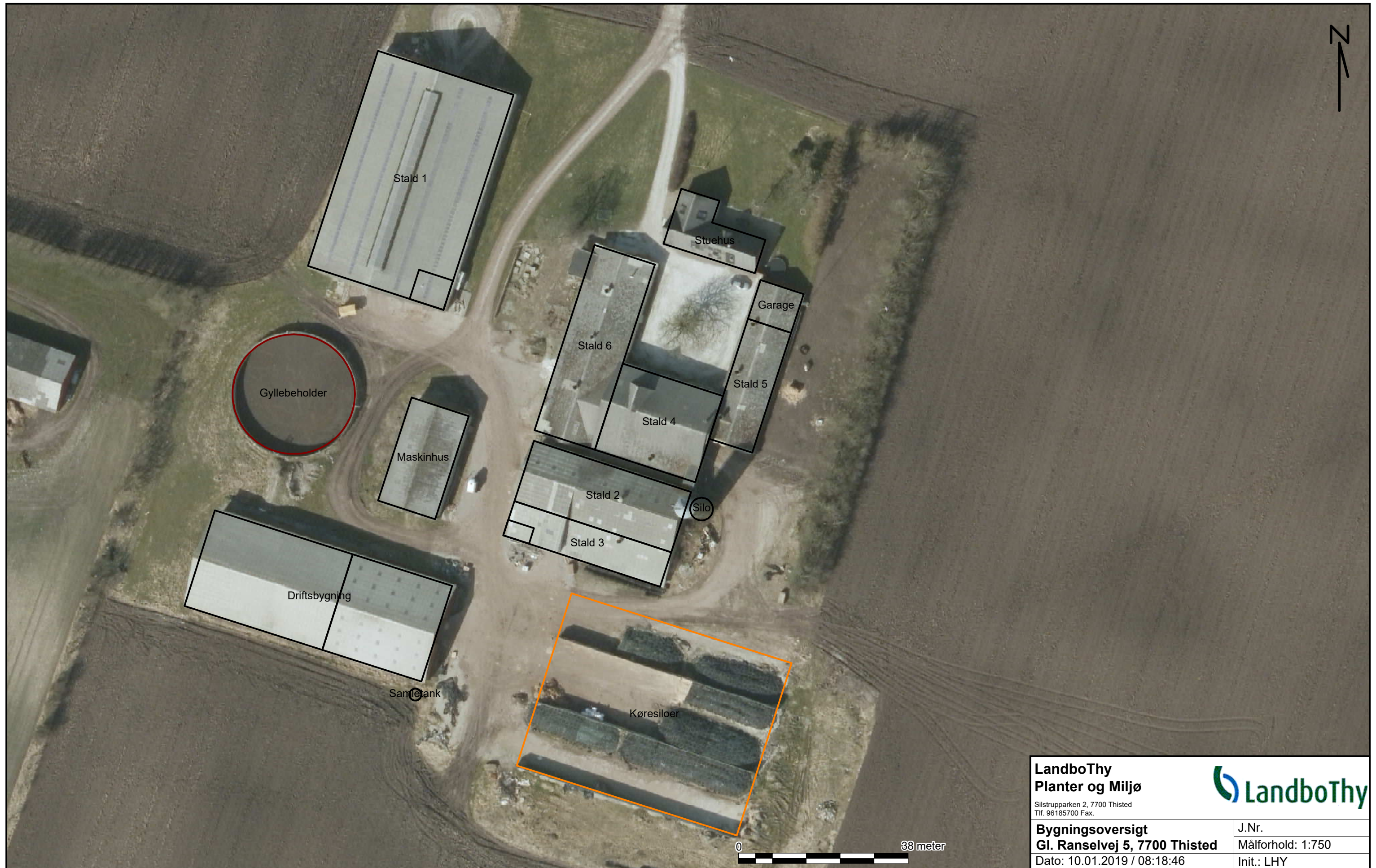
Bilag 1. Bygningsoversigt med staldnavne