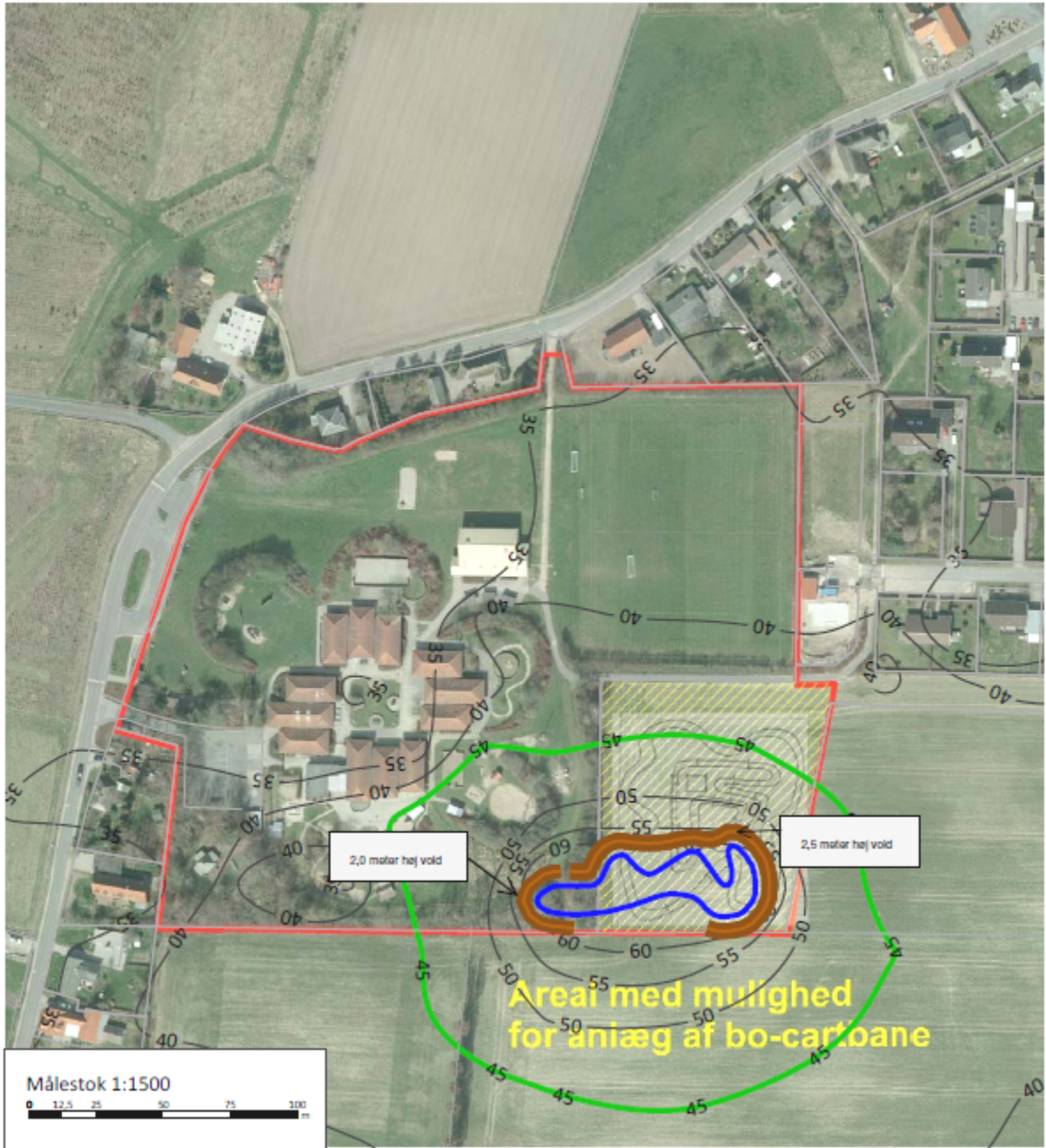
Bilag B i støjrapporten