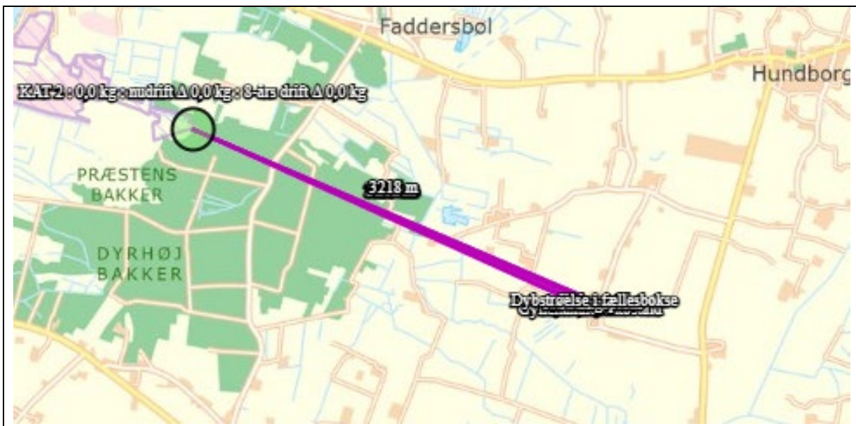
Nærmeste kategori 2-natur

Der er foretaget en ammoniakdepositionsberregning på dette område, som viser, at totaldepositionen fra husdyrbruget er på 0,0 kg NH 3 -N/ha/år. Beskyttelsesniveauet for kategori 2-natur er 1,0 kg NH 3 -N/ha/år. Dermed er kravet til ammoniakdeposition på kategori 2-natur opfyldt.