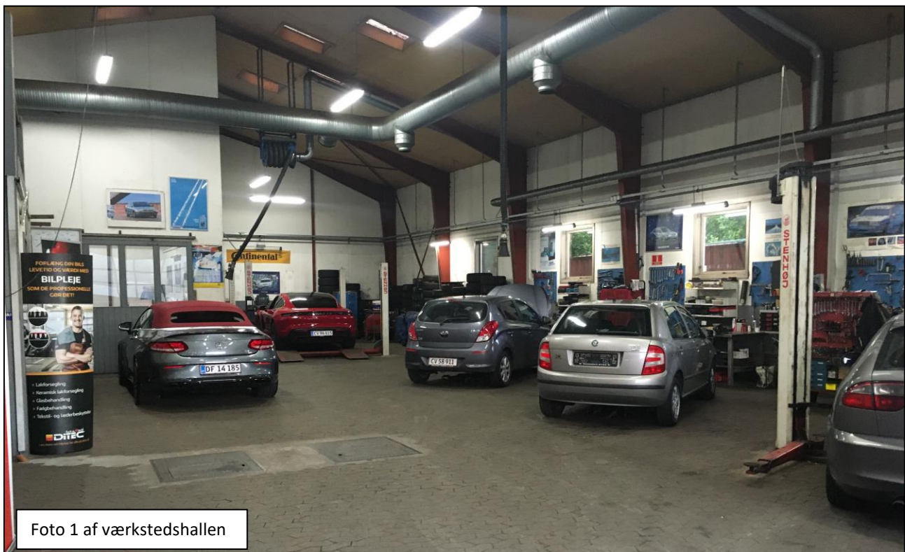
Foto 1 af værkstedshallen