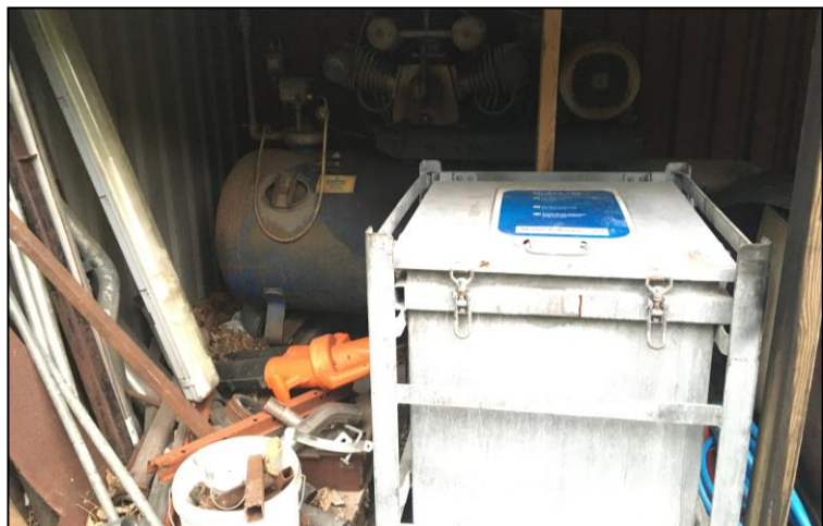
Foto 2. Kompressor placeret bag miljøcontainer.

Virksomheden har en stor port i indgangspartiet. Der foretages ingen støjende aktiviteter for åben port.