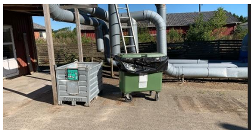
Olieklude opbevares i lukkede sække i containeren til højre på ovenstående foto