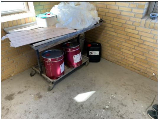
Fotos af lim, olie og sæber

Største beholder er på 25 liter og hvis der går hul på en beholder vurderes det, at indholdet ikke kan løbe ud af rummet. Der er derfor ikke risiko for forurening af jord, grundvand eller overfladevand. Dermed vurderes det, at reglerne i Silkeborg kommunes forskrift til opbevaring og håndtering af olie og kemikalier er overholdt.