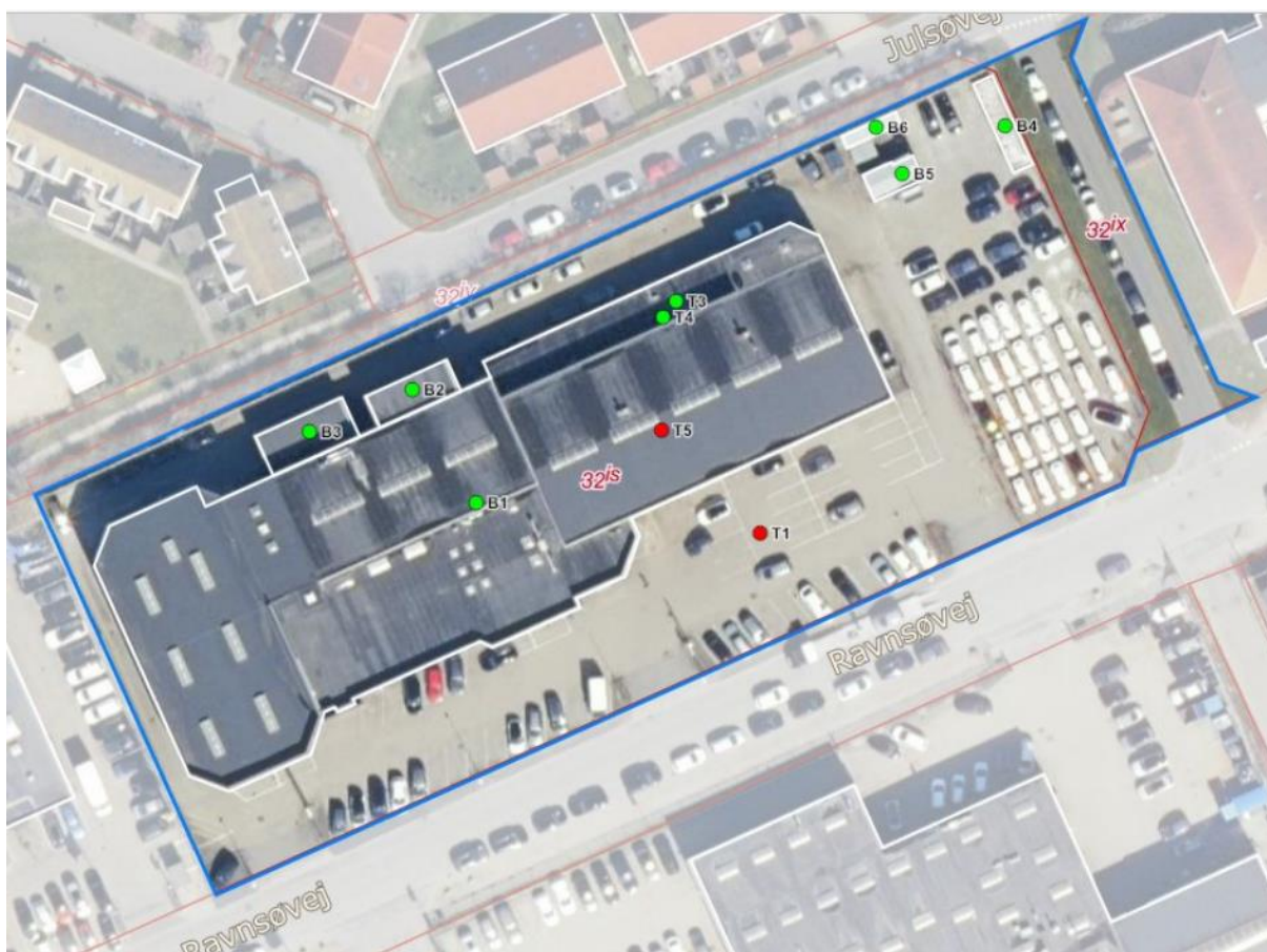
Luftfoto af virksomheden med matrikelskel fra BBR

I forhold til kommuneplanen ligger virksomheden i område 150803ER, der er udlagt til erhverv. Området er omfattet af lokalplan 263. Nærmeste boliger ligger umiddelbart nord for virksomheden kun adskilt af sti eller vej.