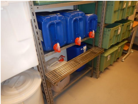
15. Spildebakke under dunke med produkter.