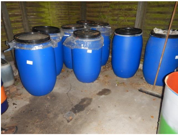
7. Skur til farligt affald – diverse spænde-lågsfade.