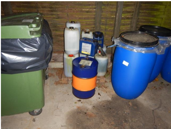
9. Skur til farligt affald.