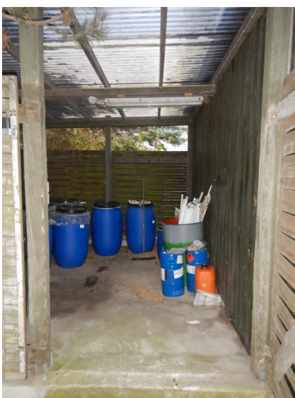
5. Skur til farligt affald.