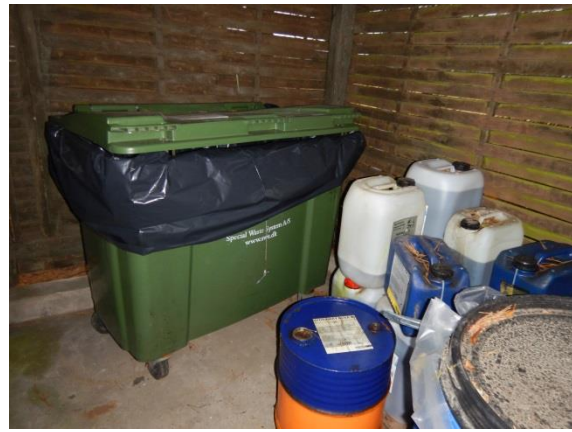
8. Skur til farligt affald – container til SWS, dunke og tromle.