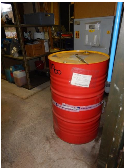
3. Kompressorrum – tønde med hydraulikolie.