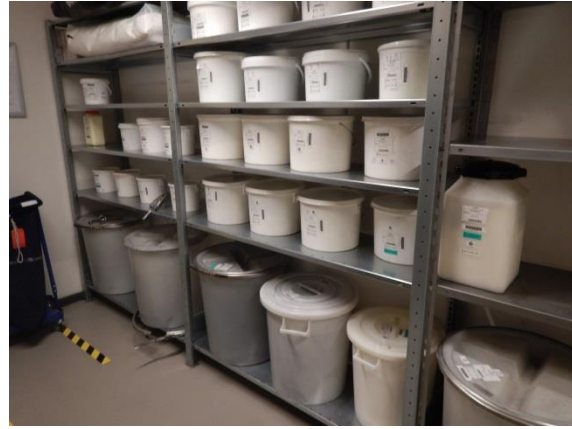
14. Opbevaring af produkter til gummistøberiet – epoxygulv og intet afløb.