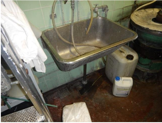
13. Skyllerum – afløb.