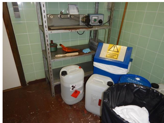
12. Skyllerum – midlertidig opbevaring af far-ligt affald.