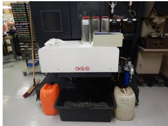
10. Værksted – CNC-maskine og metalspån-ner.