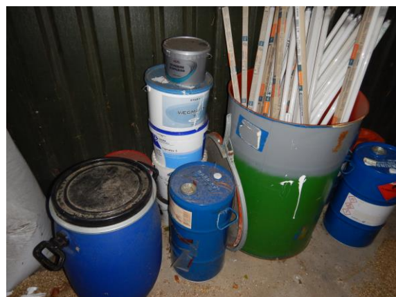
6. Skur til farligt affald – lysstofrør, spændelågsfad, malerspande og tromler.