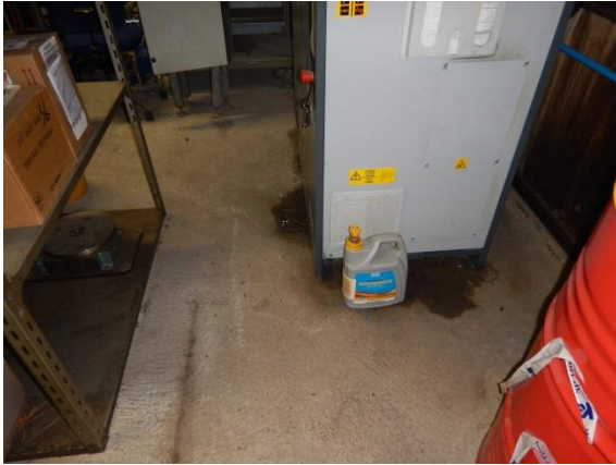
1. Kompressorrum – spild ved afløb.