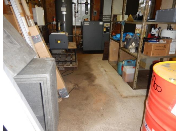
2. Kompressorrum – oliespild.