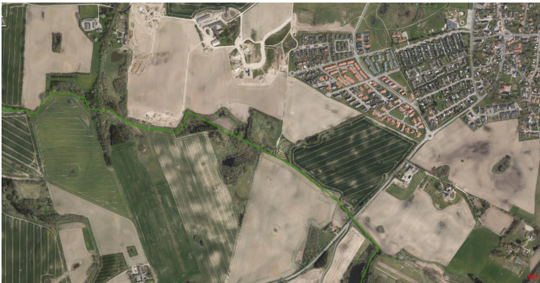
Figur 6: Luftfoto

Øst for flugtskydebanen ligger Lejre Kommunes knallertcrossbane. Knallertcrossbanen er godkendt den 14. juli 1998 efter miljøbeskyttelseslovens § 33, stk. 1.