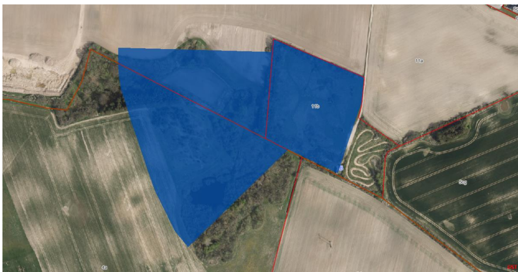
Kort 8: V1 kortlægning.