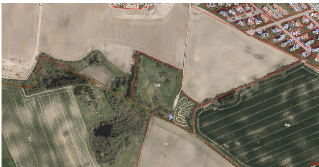
Figur 7: Luftfoto med matrikelgrænser.