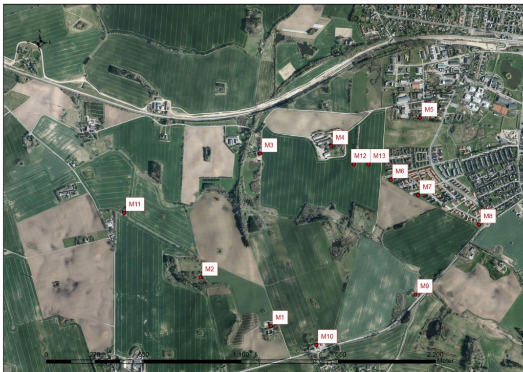
Figur 3: Beregningspunkter.

I figur 3 og figur 4 ses beregningspunkterne hos nærmeste naboer til flugtskydebanen.