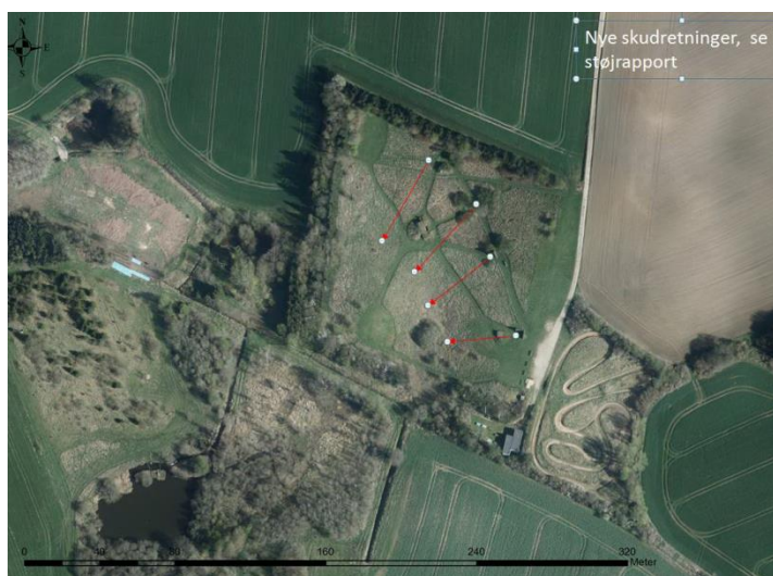
Figur 5: Angivelse af skyderetninger.

I den nuværende indretning af anlægget er der kun to støjvægge på bagduerne og venstre sideduer, men ingen andre former for støjdæmpning. Jagtforeningen ønsker at dæmpe støjen til de nærmeste naboer og dette kan ske mest effektivt ved opstilling af skydehuse omkring alle standpladserne. Dette giver en støjdæmpning til alle naboer omkring skydebanen. Nedenstående foto viser skyderetningerne: