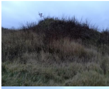
Foto 2 og 3: Materialer til slutafdækningen ligger i miler på lossepladsen.