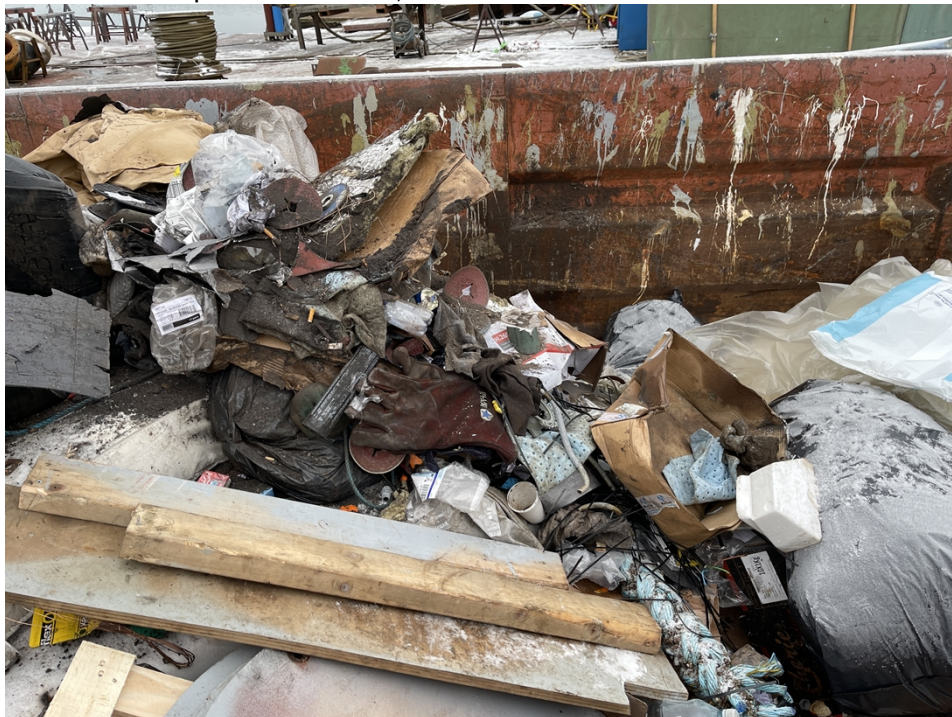
1 Billede taget ned i containeren med blandet affald

Ved en rundtur på virksomheden, blev bl.a. containeren med blandet affald besigtiget.