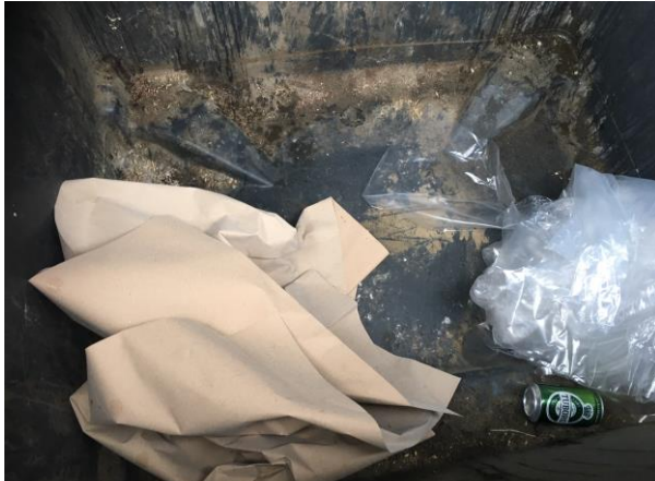
Billede 1. Plastic og papir i en affaldscontainer.