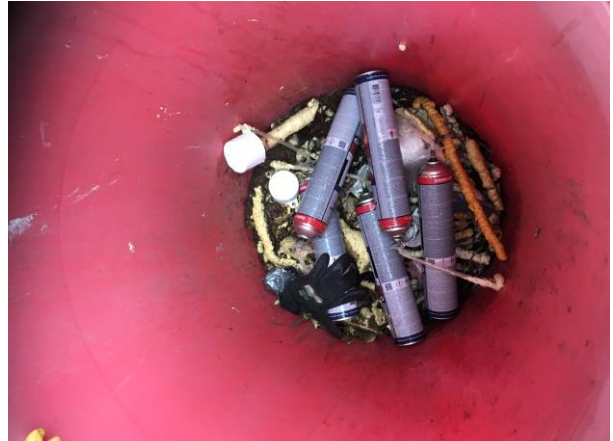
Billede 2. Spraydåser, skum og plastic i en affaldscontainer.