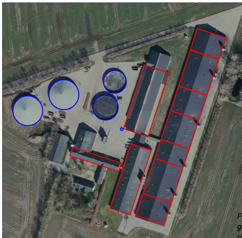
Figur 1: Luftfoto 2020 med indtegningen af stalde og gylletanke i revurderingsskema 223129.

Indtegnning af stalde og gylletanke kan ses i figur 1: