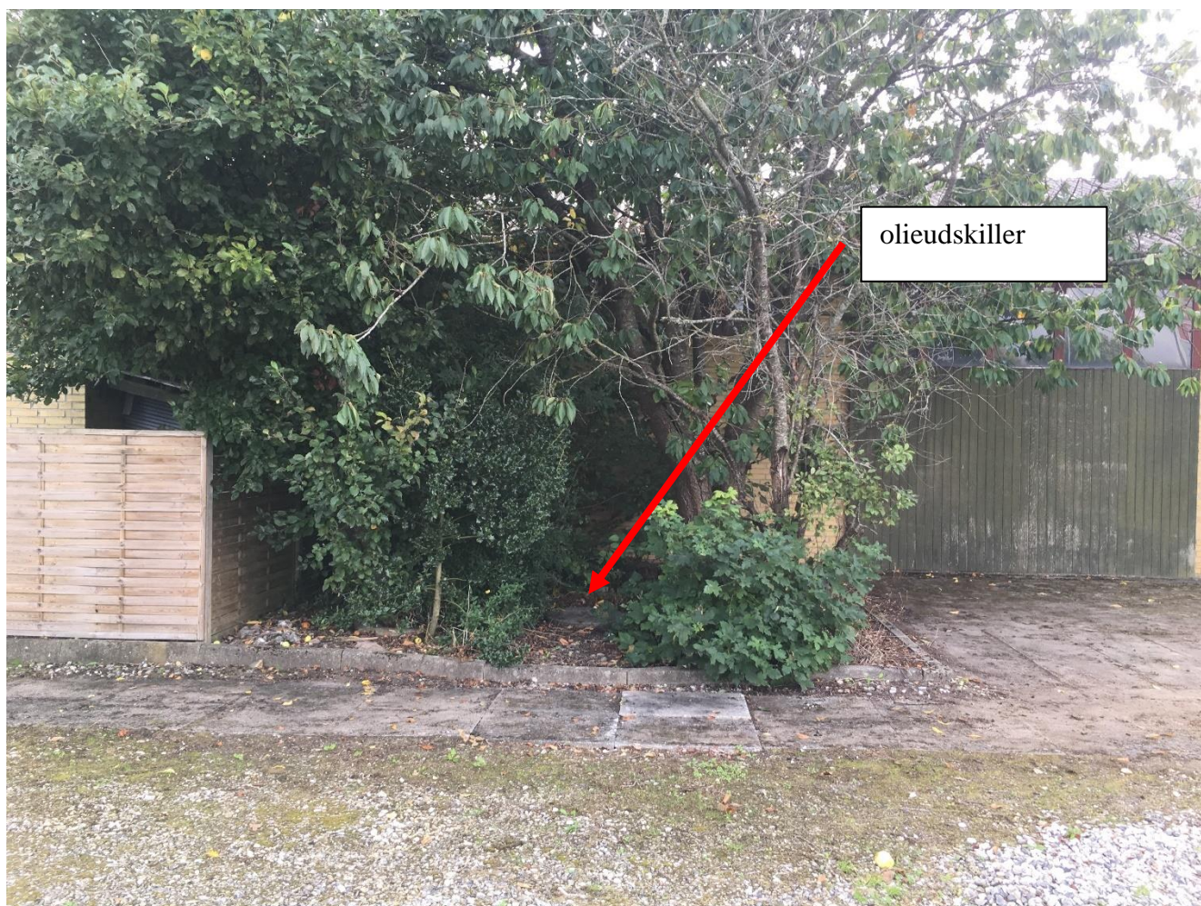
Olie- og benzinudskillere sydvestlig side af bygningen.