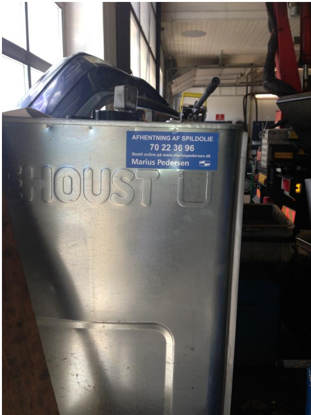
Dobbeltvæggede tanke til spildolie.