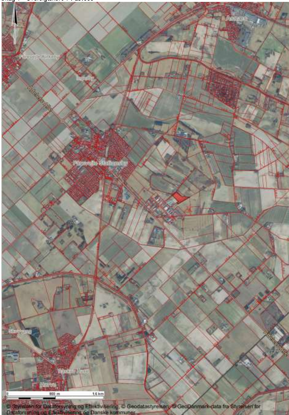
Bilag 1 - Oversigtskort 1 : 25.000