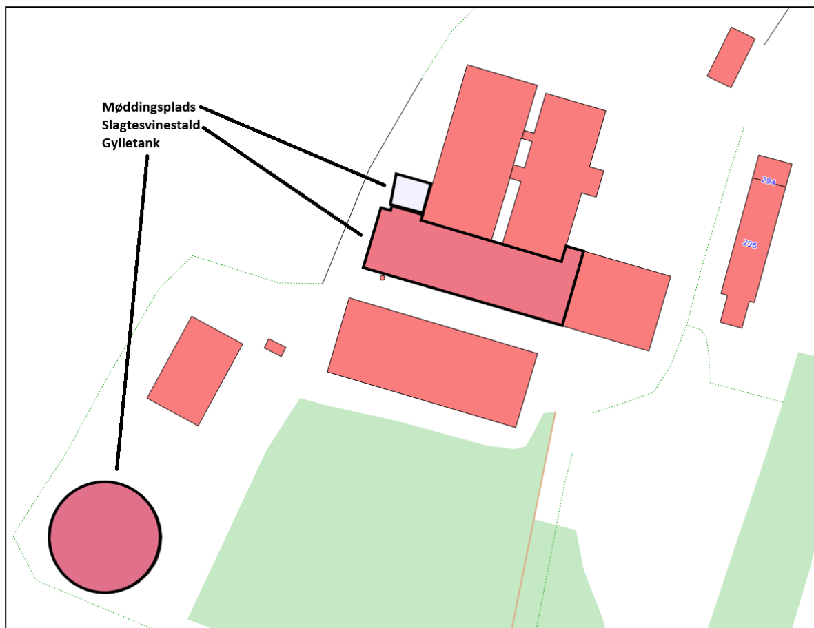
Figur 2 De aktive dele af husdyrbruget i dag.

Den 9. marts 2026 sendte jeg et oplæg til revurderingen til dig og bad dig om at korrigere, hvis mindst en af følgende oplysninger ikke var korrekte: