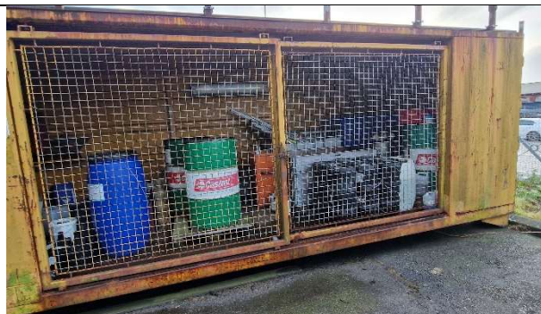
Foto 5 Miljøcontainer, der var fyldt op med diverse tønder og tromler.