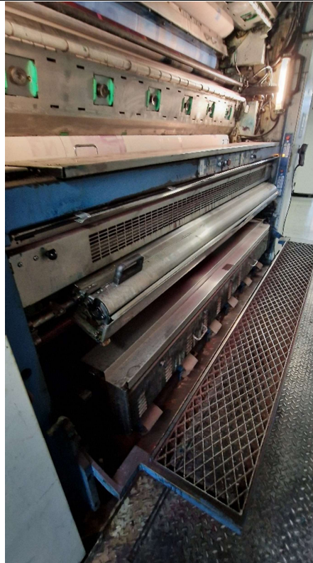
Foto 1 Trykkeri-maskine