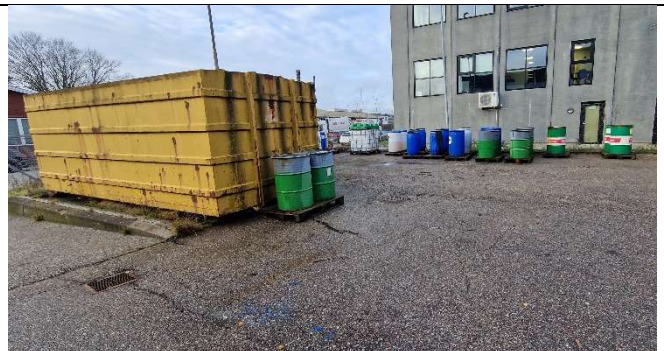
Foto 4 Miljøcontainer, samt opbevaring af diverse affald i tromler og palletanke.