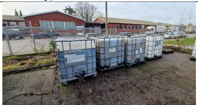
Foto 6 Udendørs opbevaring af palletanke med miljøfarligt affald. Overholder ikke kommunens forskrift.