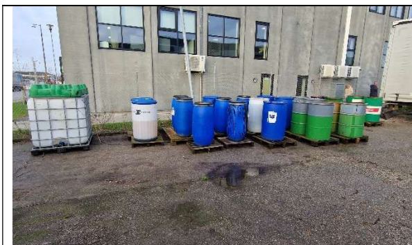
Foto 7 Udendørs opbevaring af miljøfarligt affald. Overholder ikke kommunes forskrift.