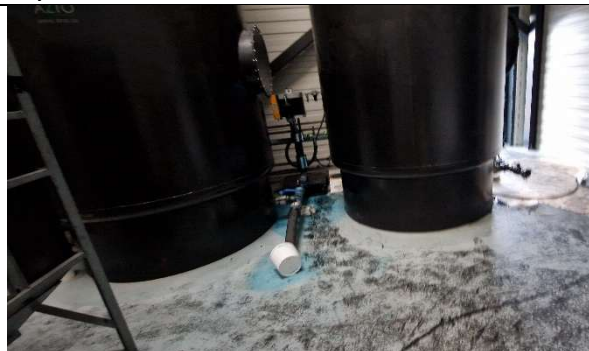
Foto 3 Store tanke til opbevaring af farve. Der er ikke afløb fra rummet.