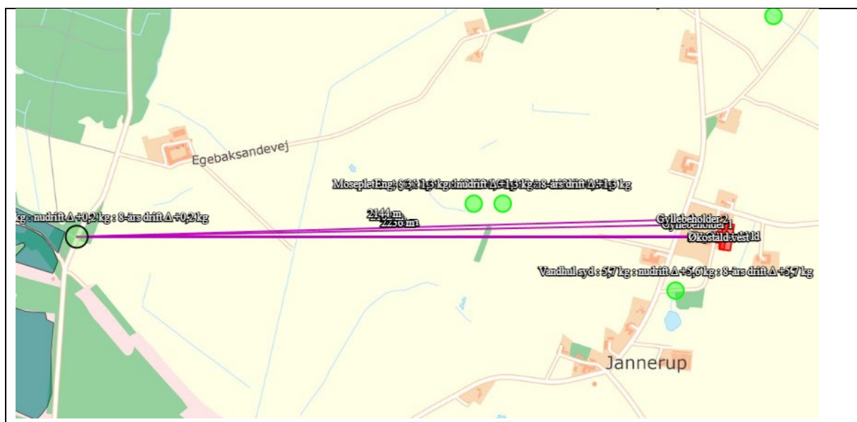
Nærmeste kategori 1-natur

Der er ikke vurderet på kumulation, da det mest skærpede beskyttelsesniveau for kategori 1-natur er overholdt (0,2 kg NH 3 -N/ha/år), det vil sige beskyttelsesniveauet, hvor der er kumulation med 2 eller flere husdyrbrug. Dermed er depositionskravet for kategori 1-natur overholdt.