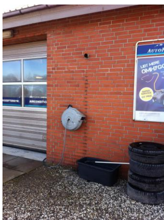
Afkast fra udstødning

Afkast for svejse- og udstødningsgas er ført ud gennem væggen. Afkastene er etableret før 1986 og er således etableret i overensstemmelse med daværende lovkraft.