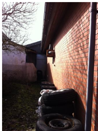
Afkast fra svejsning

Autoværkstedsbekendtgørelsens (nr. 1312 af 8. november 2016) krav om, at afkastene skal være ført mindst 1 meter over tagryggen var ikke opfyldt. Norddjurs Kommune har dog vurderet, at der ikke umiddelbart er naboer, som føler sig generet af røgen. Skulle det imidlertid på noget tidspunkt vise sig, at nogen føler sig generet, skal afkastene straks føres op i forskriftsmæssig højde.