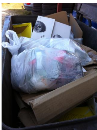
Beholder med blandet affald.

Virksomheden havde en container fra Fisker Erhverv & Industriservice ApS til blandet affald.