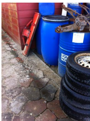
Plads til opbevaring af spildolie

Tønder med spildolie blev opbevaret udendørs på plads med fast belægning og opkant samt overdækning.