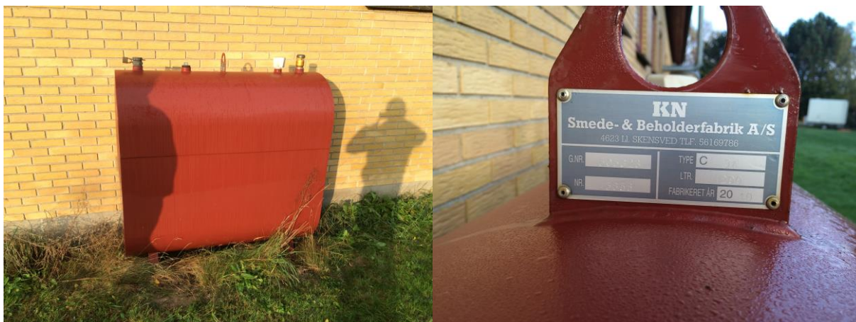
Overjordisk olietank til fyringsolie (billede fra tilsyn 2016).