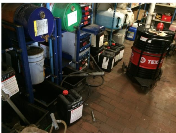
Opbevaring på tæt gulv uden afløb til kloak (billede fra tilsyn 2016).

Der er siden sidste tilsyn foretaget oprydning i væsker, og opbevaring sker på spildbakke eller på tæt gulv uden afløb.