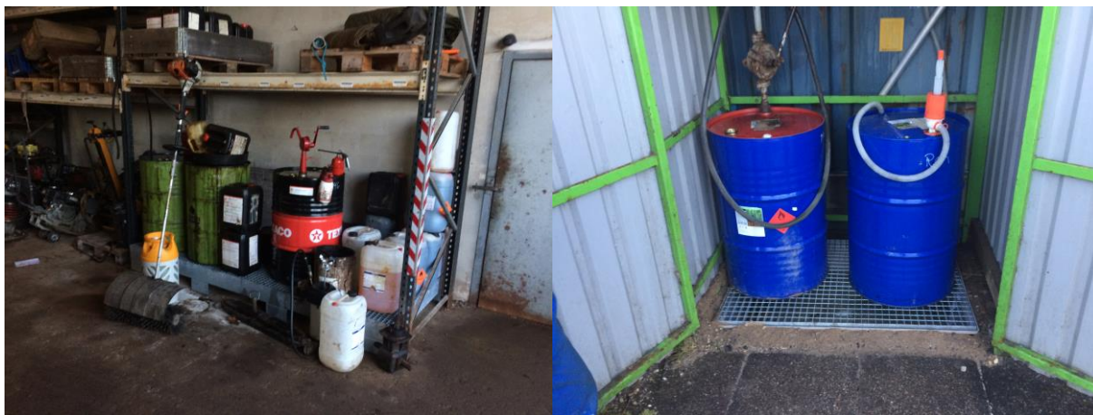
Lovlig opbevaring på spildbakke.